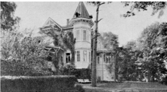
Meriniemi v. 1963 uudelleen kunnostettuna KPS - KSS:n ravintolaksi

Pitkäluodon maja rakennettiin 1989 ja avajaiset vietettiin 2.7. 1990 ja sen nimeksi tuli Ystävyysden tupa.