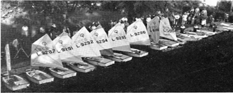
18 lasikuituoptin kastetilaisuus Meriniemessä keväällä -83

Kaiffari I vikloille 1952 , Kaiffari II vuonna 1967, Kaiffari III 1982, poijuvene Jannu 1987, Buster, kumivene Lätyskä, seitsemän optia, 380, Still sekä uutena H-vene.