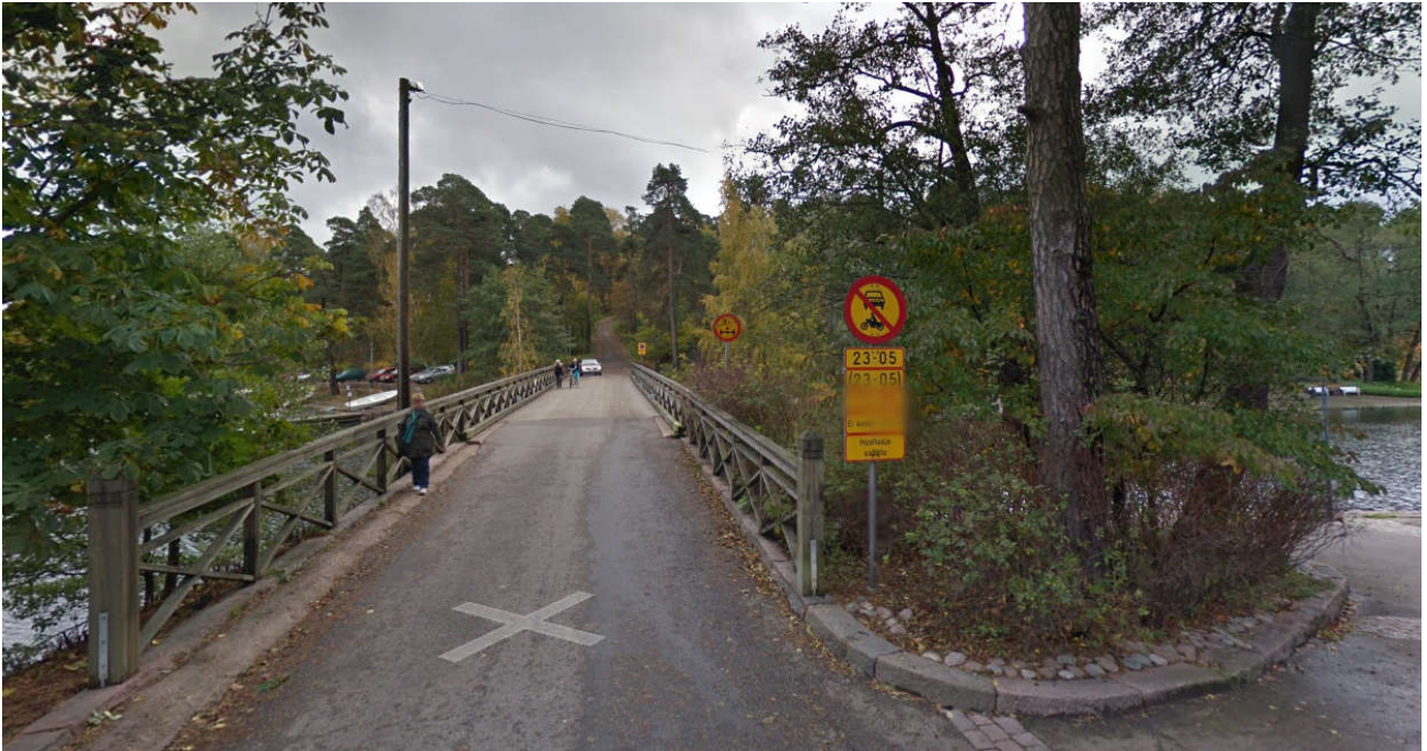
Tallinnankadulta käännytään Meriniementielle kapealle sillalle, jossa mahtuu kaksi autoa kohtaamaan. Seurataan tietä vasemmalle kunnes rantaportti tulee vastaan.